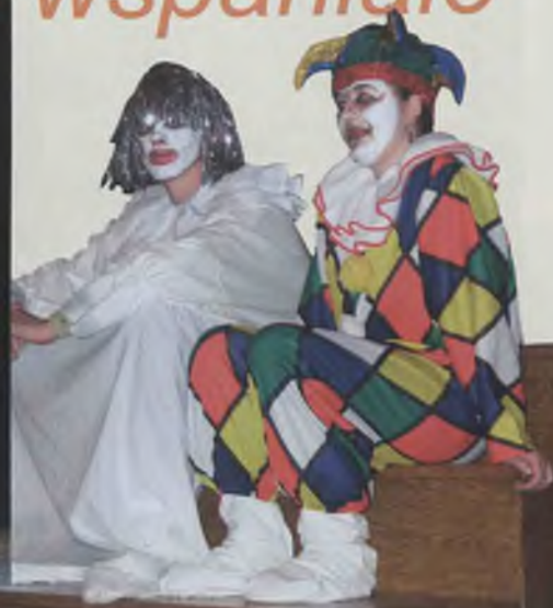
Mimy ze szkoły przysposabiającej do pracy stanowiły element scenografii koncertu finałowego