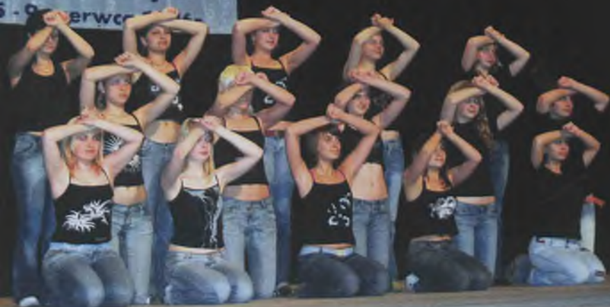
Teatr Ciszey, Grodno