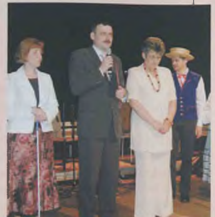
Wystąpienie ministra Pawła Wypycha