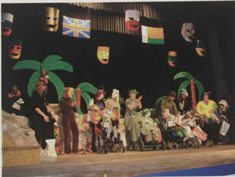
Prezentacje sceniczne były bardzo kolorowe i pełne ekspresji