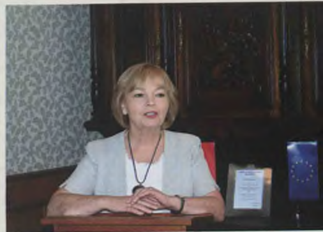
Posłanka Danuta Pietraszewska