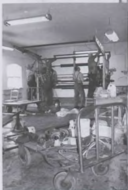
Trwają procesy modernizacyjne

Jest jedynym zakładem w Bielsku-Białej, który kontynuuje bogate tradycje włókiennicze tego miasta, tradycje sięgające XVI wieku. Jest ponadto jednym z nielicznych w Polsce zakładów włókienniczych produkujących tkaniny ubraniowe, kostiumowe i płaszczone