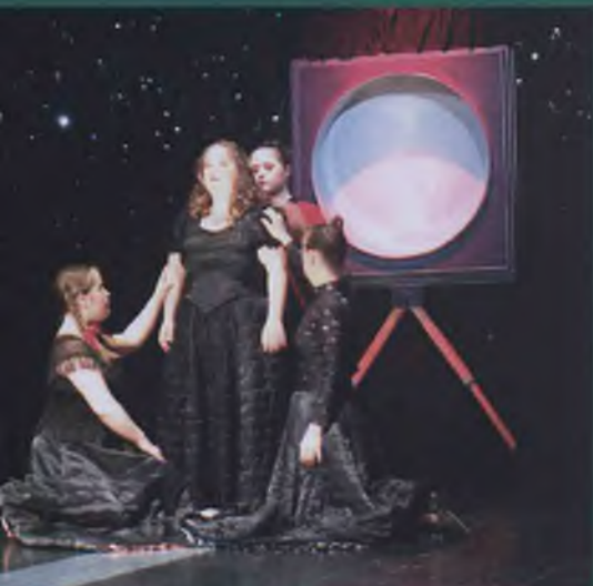
Teatr Baltazar, Węgry

– W jakim kierunku, zmierza sceniczna aktualizacja takich środków artystycznego wyrazu jak gest i dźwięk w tym rodzaju teatru, który czyni je – z powodu naturalnych uwarunkowań aktorów – nadrzędnymi?