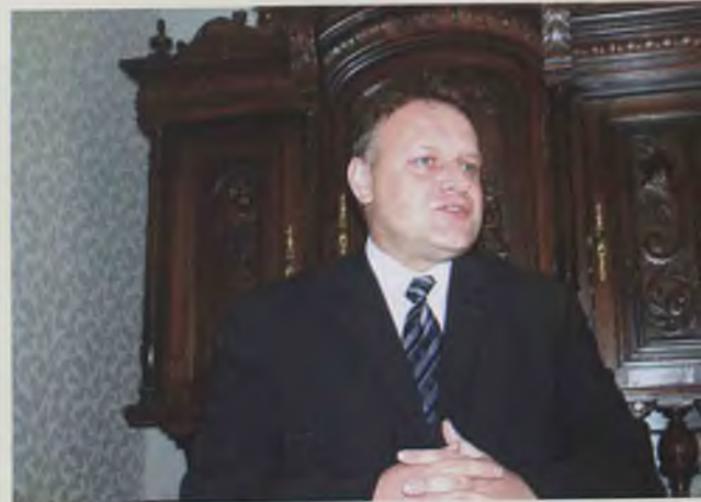
Posel Jarosław Duda