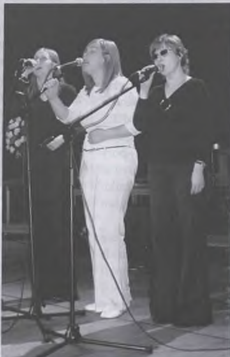
Zespół „Nadzieja” – laureat nagrody muzycznej za 2005 r.

Koncert zakończyła kolejna gwiazda – Ewa Bem, porywająco wykonując zarówno swoje znane, naznaczone swingową rytmiką przeboje, ale również nowe, już bardziej liryczne, w których debiutowała jako autorka tekstów. Jej obycie sceniczne, perfekcyjne, a jednocześnie nie wykluczające pewnej estradowej swobody interpretacji sprawiły, iż uczestnicy żądali bisów, a zegnali artystkę owacją na stojąco.