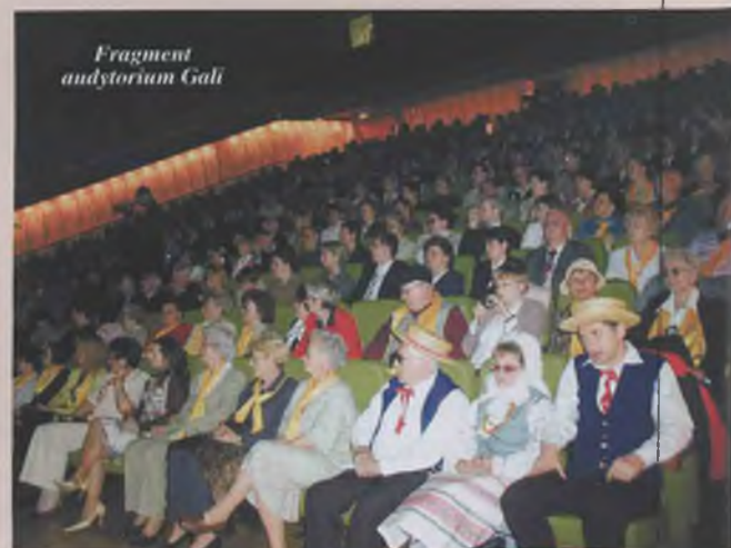
Fragment audytorium Gali