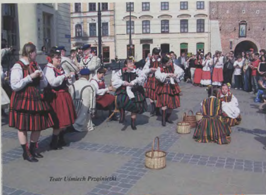
Teatr Uśmiech Przyszłości