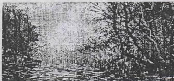
"BAGNISKO" techn. komputerowa N. Rossak 1991