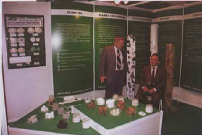
Fragmenty ekspozycji, od góry „Pokój” Łódź, „Enko” Gliwice, „Ekochem” Siemianowice Śl.