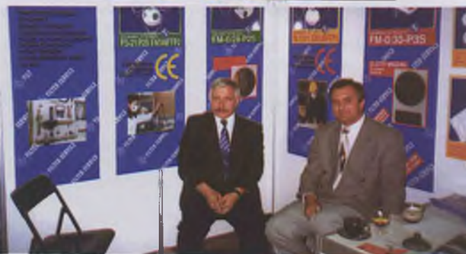
Fragmenty ekspozycji „Wybrzeża”, WTZ przy „Orpel” i „Filter-Service”