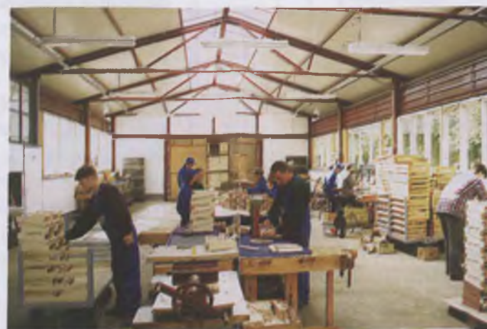
... w której już odbywa się produkcja