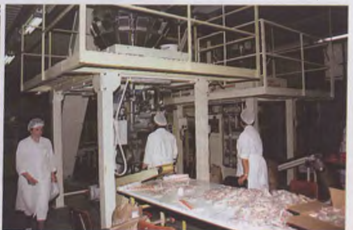
Goście zwiedzają nowe hale produkcyjne