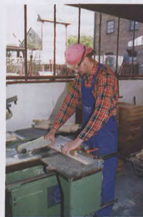
Zakład stolarski w Krzeszowie

gatunku, pochodzącego z jednego tylko regionu Polski. Strzec trzeba tajemnic swojego wyrobu, który dodatkowo musi być ekologiczny i z drewna grzybobójczego i bakteriobójczego. Musi być najlepszy i z najlepszych materiałów.