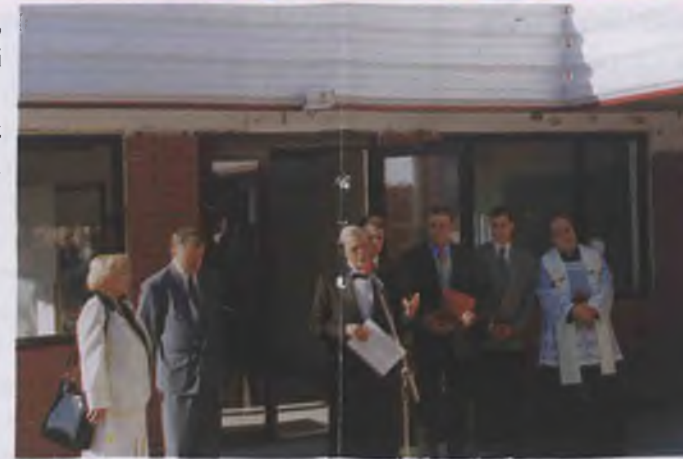
Oficjalne otwarcie nowej hali montażu...

Wszystkie akcesoria drewniane wytwarzane są z wyselekcjonowanego drewna określonego